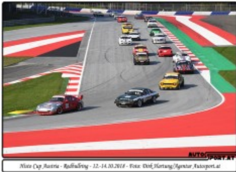
Histo Cup Anhang K - Redbullring 2018