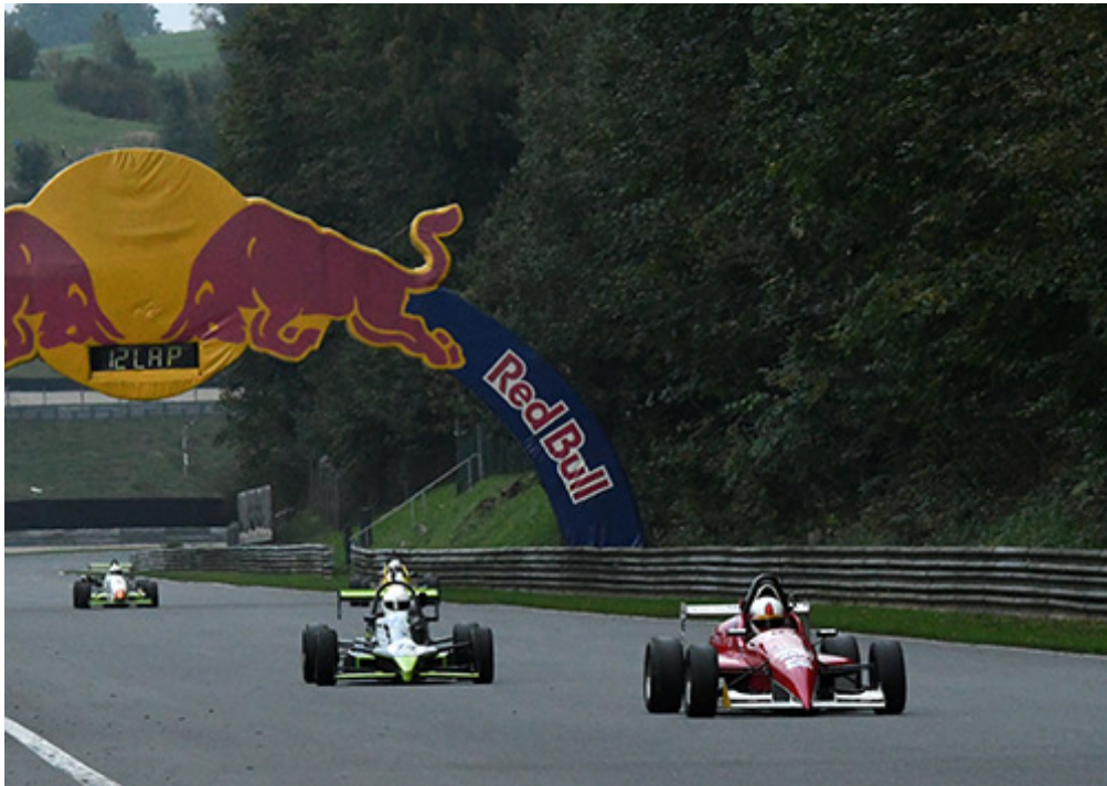
Mischte im Feld der Formel Historic ordentlich mit: Patrick Schober - 14 Jahre